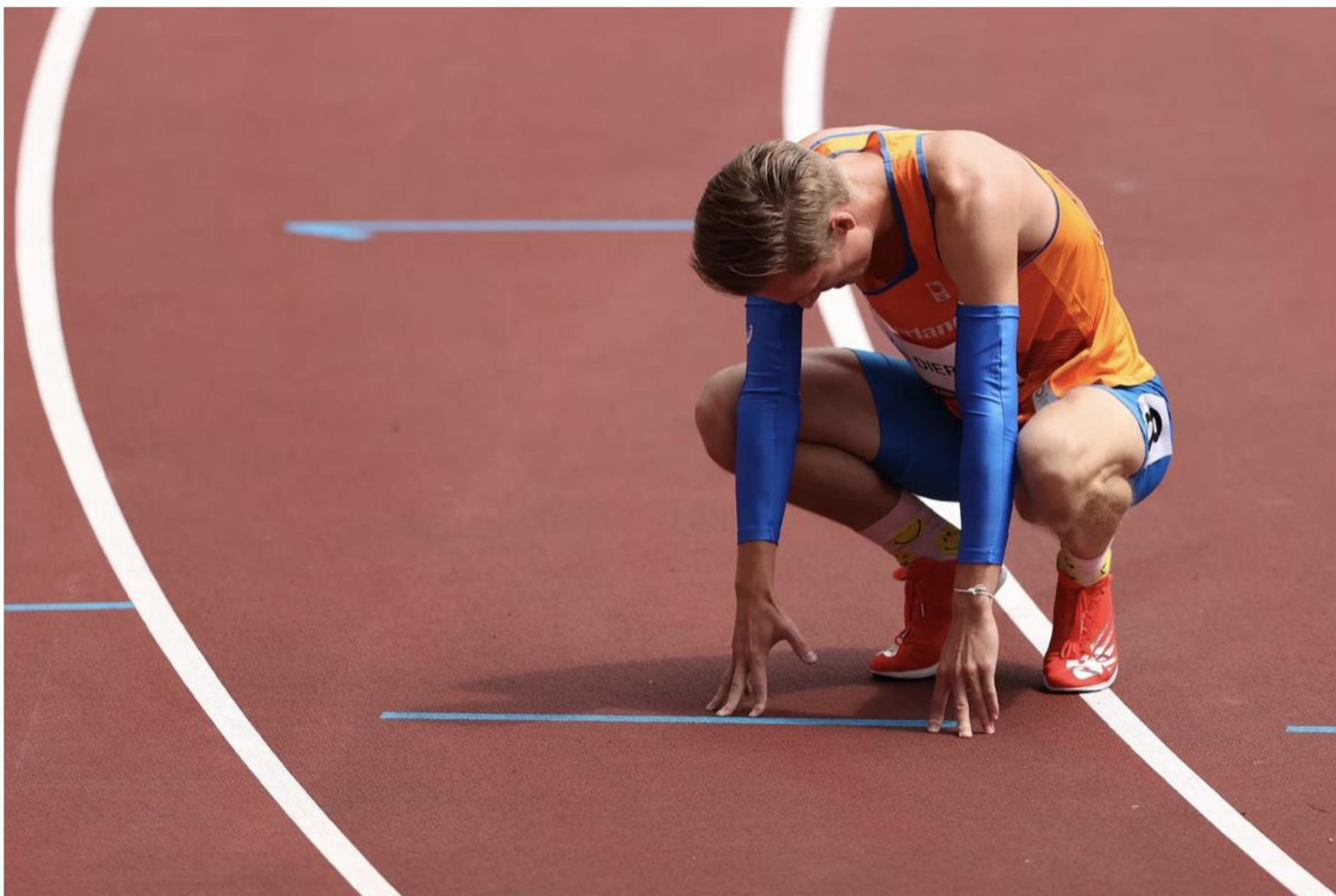
Sprinter Tony van Diepen op de Olympische Spelen in Tokio.